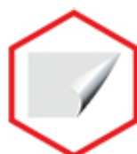
PELÍCULA DE PROTEÇÃO