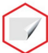
PELÍCULA DE PROTEÇÃO